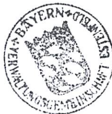
Rosalinde Schraud 1. Bürgermeisterin